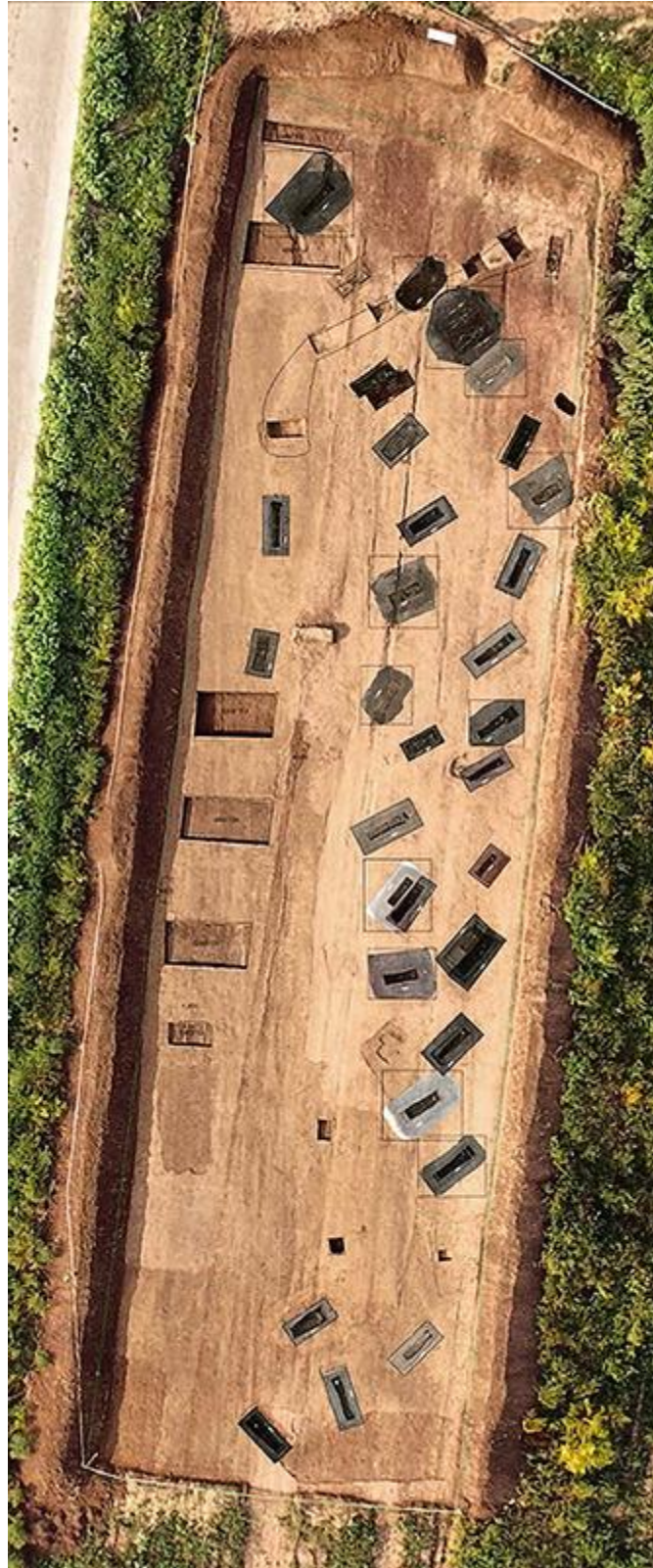
Photographie aérienne et orthophotos des tombes du secteur nord du cimetière de Pianliancheng.