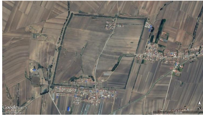
III. 2 Vue satellite du site de Pianliancheng.

ville dans le parcellaire : deux villages se nomment « village de la porte nord », « village de Pianliancheng ».